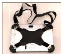
ハンドストラップ